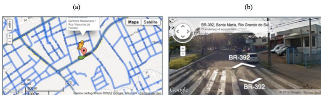
Figura 3. Implementação usando API de geolocalização em diferentes serviços de visualização de mapas

A diferença visual entre os três serviços de mapas é a distribuição da interface nos mapas, porém, todos são intuitivos para os usuários. No serviço Nokia Maps percebeu-se a possibilidade de modificar o tipo de medida na escala do mapa entre as unidades de medida metros e pés, diferente dos outros serviços que são apresentadas em metros ou jardas. Por outro lado, o serviço Google Maps disponibiliza a opção da ferramenta Street View para visualizar imagens de locais através de imagens em 360 graus no nível da rua. A Figura 3 apresenta a ferramenta Street View do serviço Google Maps.