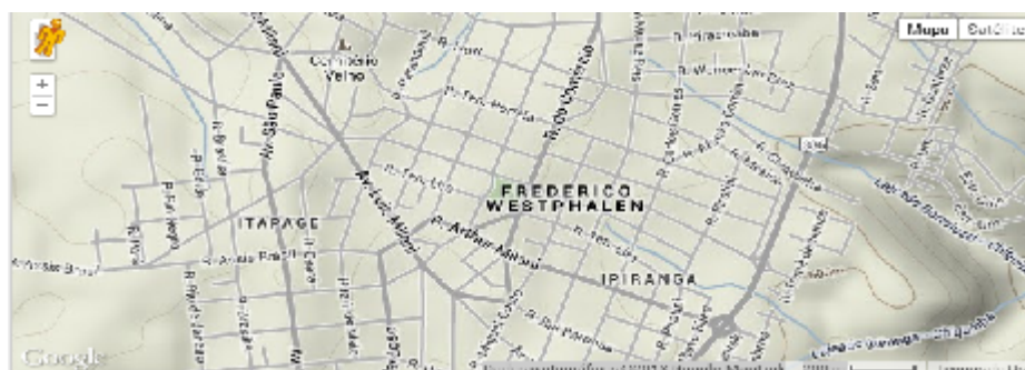
Figura 23 - Mapa inserido na página através dos recursos da API do Google Maps.

O sistema proposto pretende demonstrar que uma ferramenta que se utiliza de tecnologias da informação atuais, voltadas ao armazenamento, exibição e manutenção de dados, associada ao uso de dados georeferenciados podem auxiliar a melhor utilização de recursos materiais e, principalmente humanos na área de segurança pública. Coordenadas geográficas são as peças chave para a interligação do sistema desenvolvido com a API do Google Maps, que proporciona a visualização de imagens e a capacidade de interação de forma segura e robusta com a aplicação.