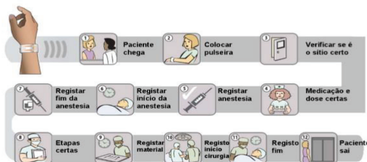
Figura 1: Sistema de atendimento no bloco operatório do CHMG.

Segundo Silveira (2017) um sistema de RFID é composto basicamente por uma antena que faz a leitura do sinal e transfere a informação para um dispositivo leitor. Sendo assim a antena transmite as informações para o leitor que por sua vez irá converter as ondas RFID para informações digitais, depois de convertidas elas poderão ser processadas por um computador.