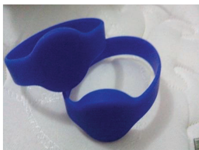
Figura 3: Pulseira RFID

Para que todo esse processo de leitura seja feito poderia ser implantado no arduino um banco de dados onde seria salvo os dados das pulseiras e depois o retornaria para fazer a confirmação, podendo também ser utilizado um cartão de memória que teria os dados das pulseiras salvos e que retornaria para o arduino o código assim que inserido nele, mas desse modo toda vez que as pulseiras fossem trocadas seria necessário trocar o código do cartão de memória para salvar novamente o número que estaria autorizado a abrir a porta e sendo assim inseri-lo novamente no arduino.