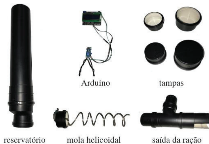
Figura 2. Elementos do protótipo do Alimentador.

controlando a quantidade de ração que cairá no pote. A partir disso, o Arduino acionará o motor que fará com que a mola, que possui um formato helicoidal, gire em sentido horário empurrando a comida para dentro do pote pela saída da ração, com base nos horários estabelecidos anteriormente. As tampas servem para vedar o tubo, para evitar que a ração fique exposta e assim, estrague.